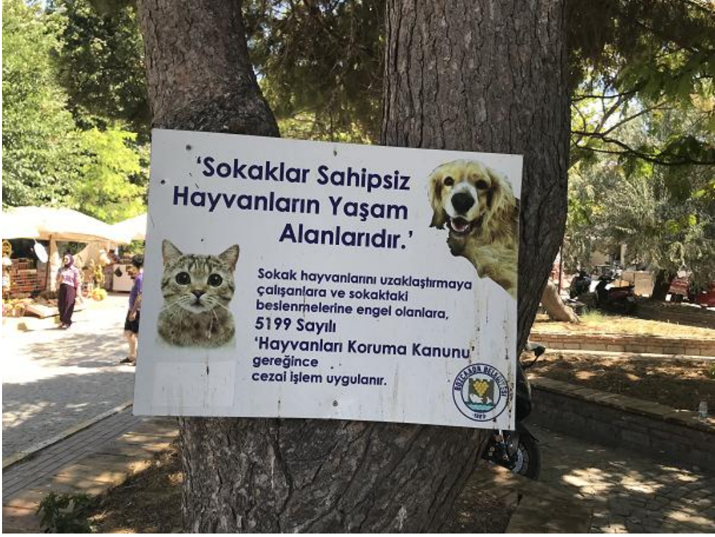
Çanakkale-Bozcaada, insanlar ve diğer canlılar başka kapiya, mulasah 2023