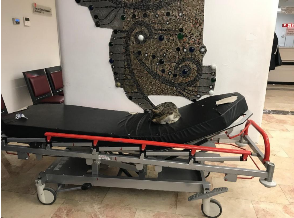
Bahçede, pencere diplerinde canı sıkılan bir kedi, hasta sedyesinde muayene sırasını beklerken. Mulasah_2025