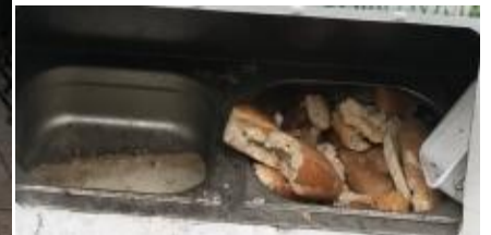
Ankara-Altındağ Hamamönü, Yorumsuz, mulasah2023